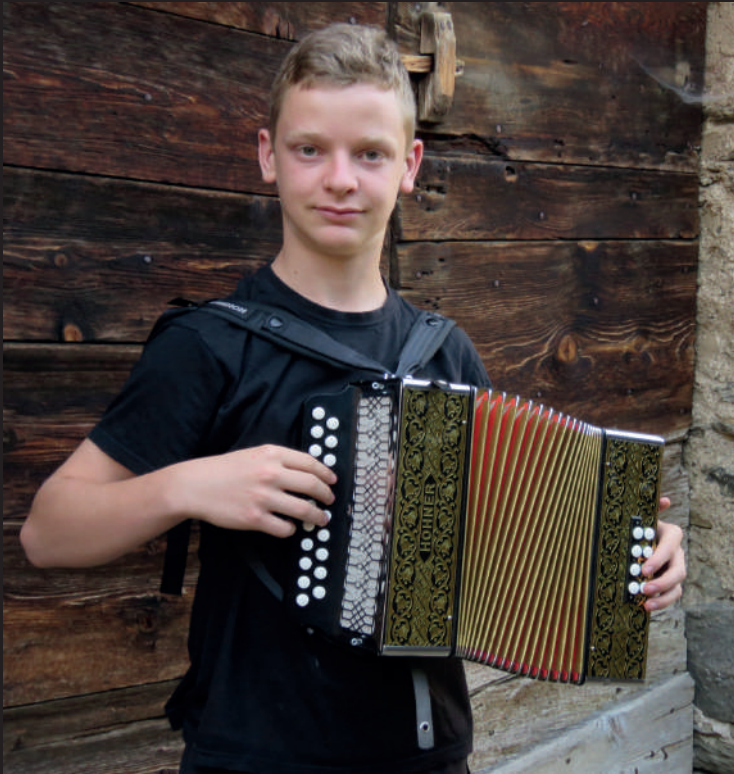
Biel Visen. Durro (Alta Ribagorça)

LA SEU D'URGELL i ARSÈGUEL Del 28 de juliol a l'1 d'agost Amb concerts a Puigcerdà i a Castellbò